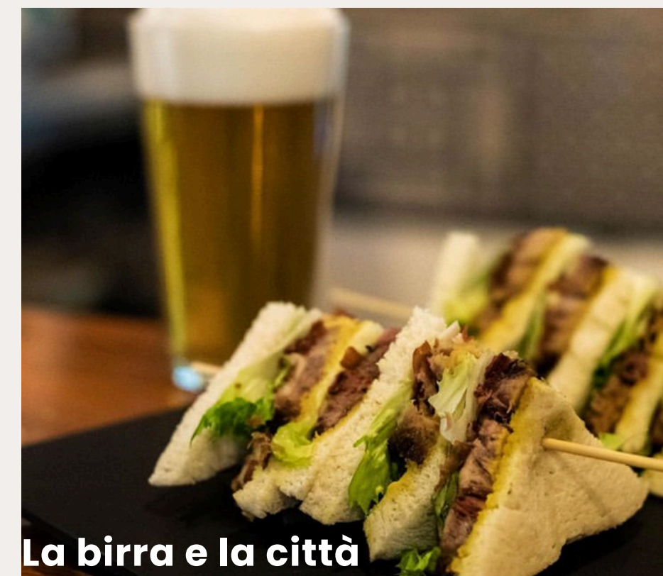
La birra e la città