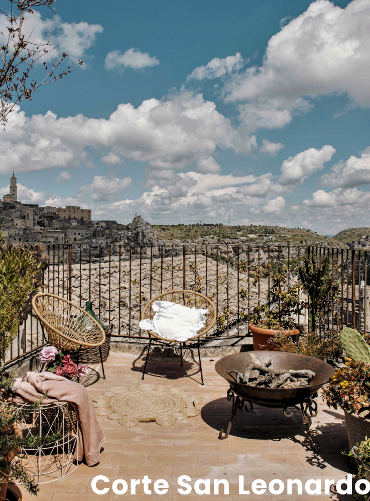
Corte San Leonardo

Ti suggeriamo 4 posti dove scattare le foto migliori per i tuoi social! Mi raccomando, ricordati di taggare #cortesanleonardomatera