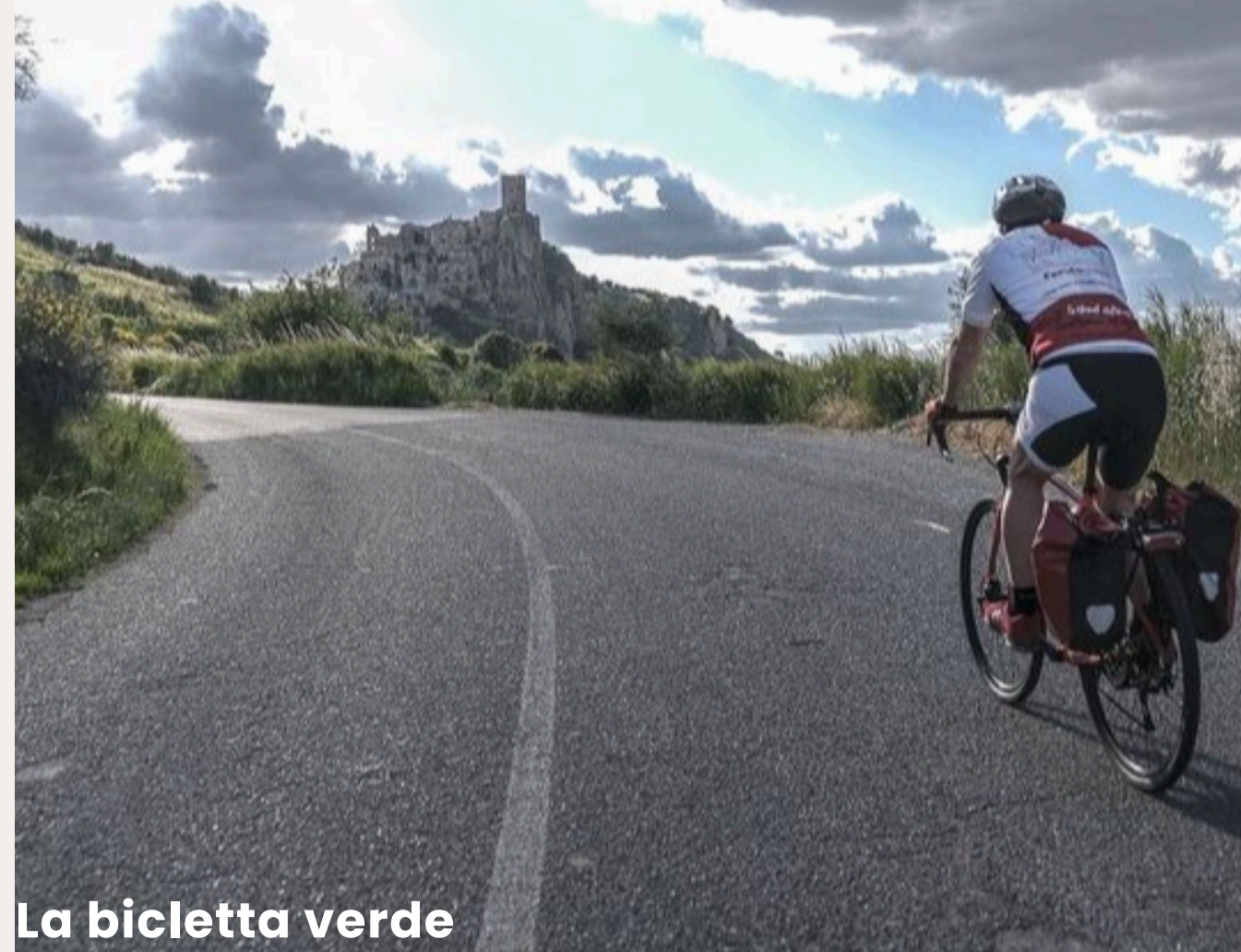
La bicletta verde

https://www.cortesanleonardo.com/gift-box/