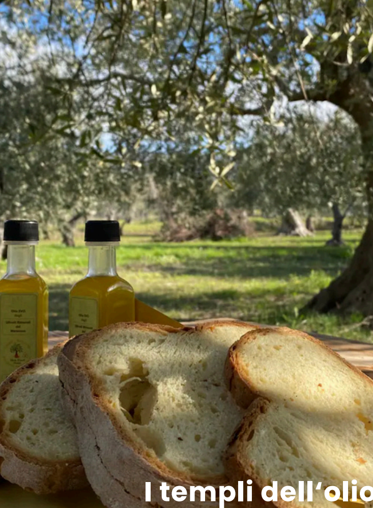
I templi dell'olio

Abbiamo pensato a voi, con alcune ESPERIENZE che riteniamo possano arricchire la vostra vacanza.