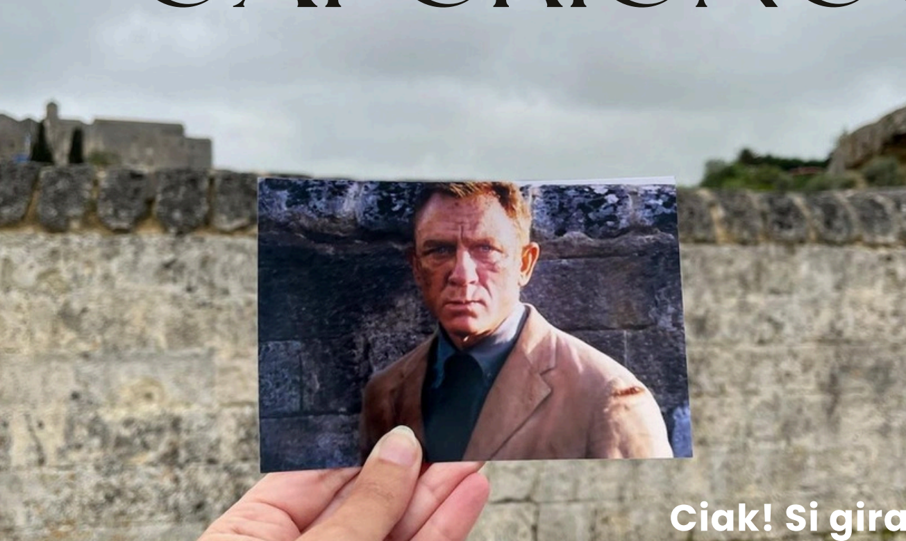
Ciak! Si gira

https://www.cortesanleonardo.com/gift-box/