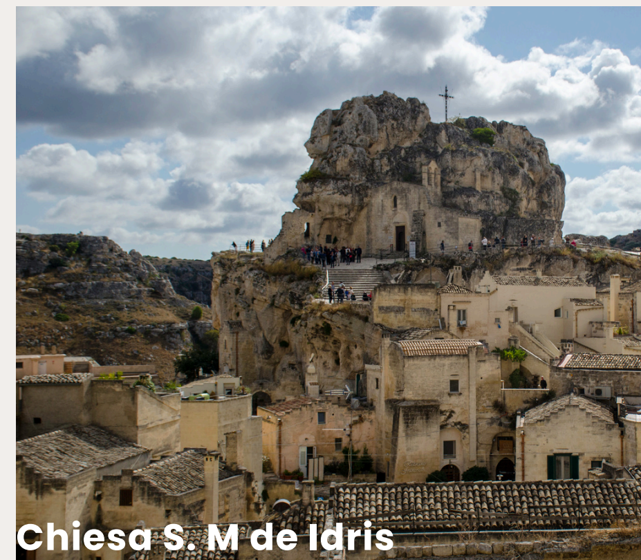
Chiesa S. M de Idris