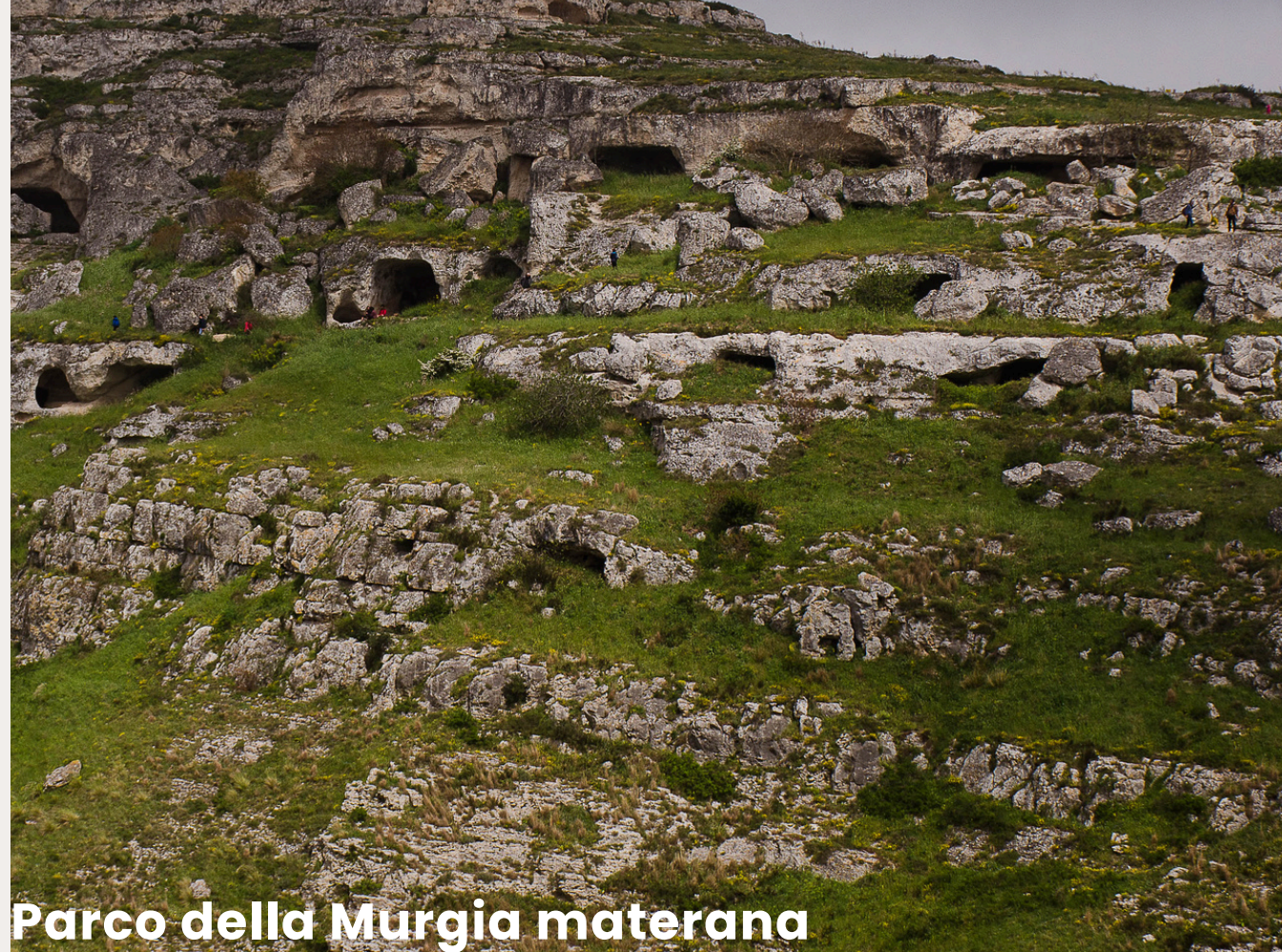
Parco della Murgia materana